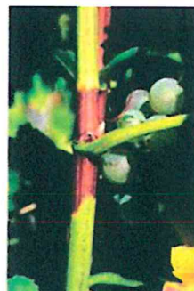
Egyenetlen fásodás