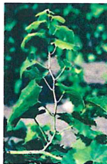
Ízközök rövidülése